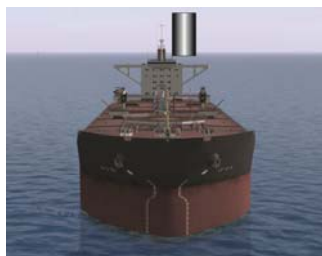
Figure 144 : marque d'un navire handicapé par son tirant d'eau