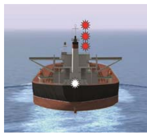
Figure 145 : navire handicapé par son tirant d'eau > à 50m avec ou sans erre